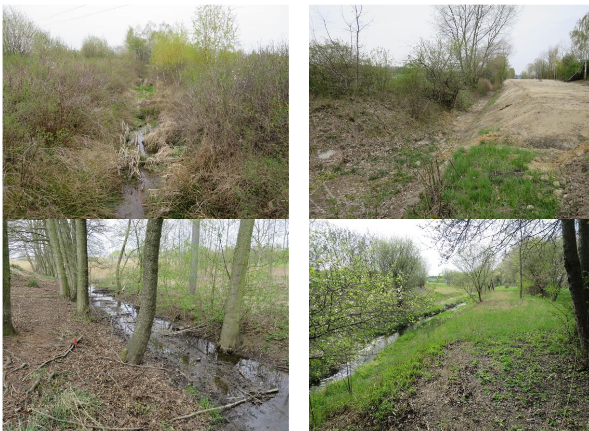
obr. 1 - Fotodokumentace Svépravický potok s navrhovanou revitalizací nivy

U řešeného vodního toku byl zjištěn záměr místního rybářského sdružení na „převod“ vody z pramenné oblasti Svépravického potoka (oblast Xaverov) do pravostranného přítoku Svépravického potoka. Daný přítok se nachází jižním směrem od řešené oblasti a dle centrální evidence vodních toků je označen IDVT 10259137 - bezejmenný tok. Daný návrh byl v rámci studie řešen se zástupci Magistrátu hlavního města Prahy s negativním stanoviskem. Z daného důvodu záměr nebyl ve studii dále řešen.