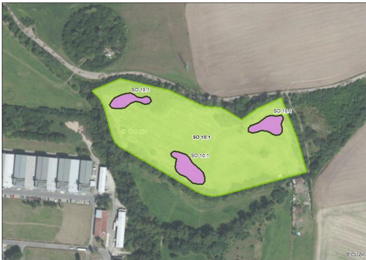
obr. 2 Přehledná situace opatření