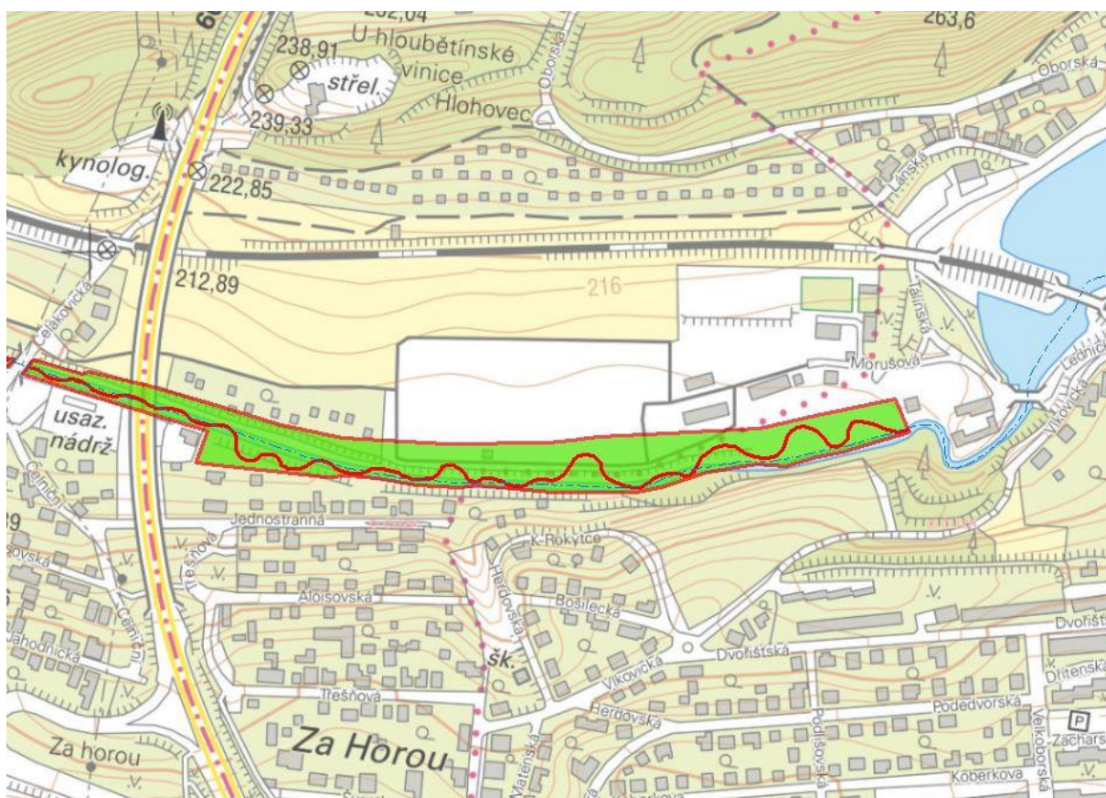
obr. 1 – Oblast revitalizace