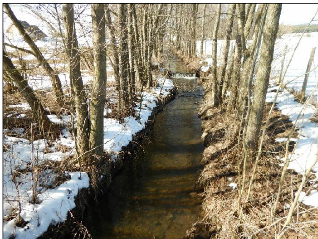
Obr.1: Technicky upravený úsek toku s nepřítliš hodnotným břehovým porostem, vhodný pro revitalizaci