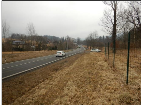
obr. 1 a 2 – systému odvodnění kolem kruhového objezdu nad Mníškem je sveden do málo kapacitního propustku a větší průtoky jsou přelévány přes silnici