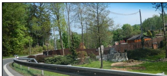
obr. 5 – koryto vodního toku svedené do žlabu v části nad křížením se silnicí