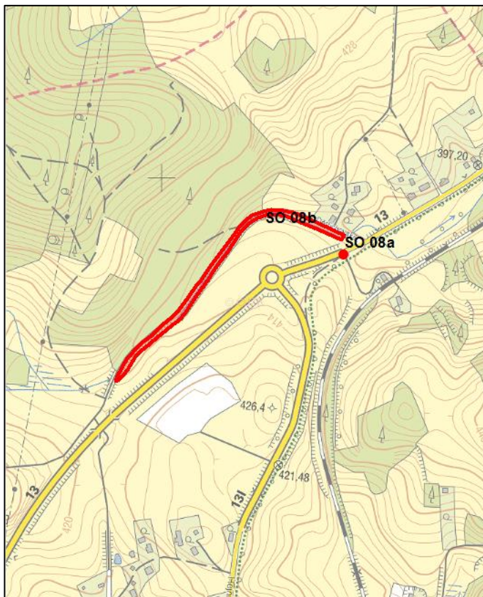
obr. 7 - Přehledná situace opatření