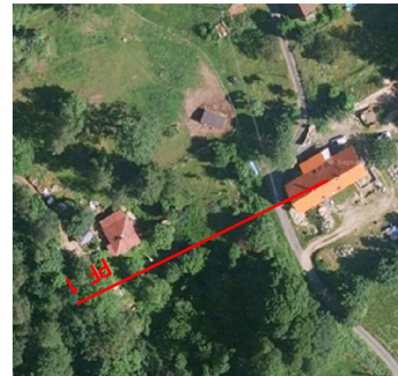
B.3.SO 05.4 Údolnicový profil navrhovaným opatře SO 05c