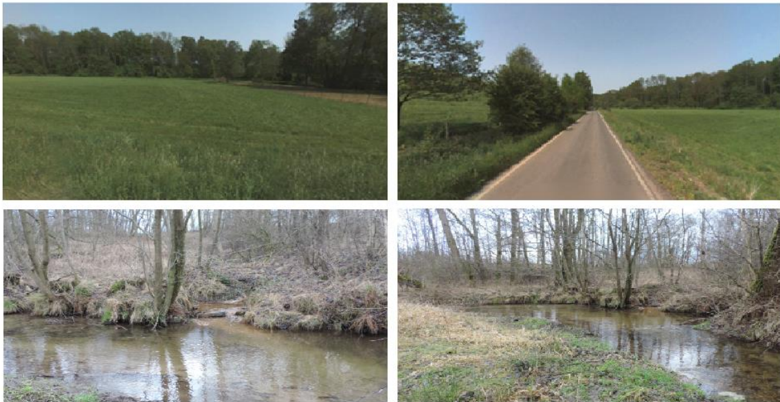
obr. 1 - Fotodokumentace ohroženého místa 0009

Lokalita byla v rámci analytické části definována jako ohrožené místo a evidovaná pod identifikátorem ohroženého místa 0009 .