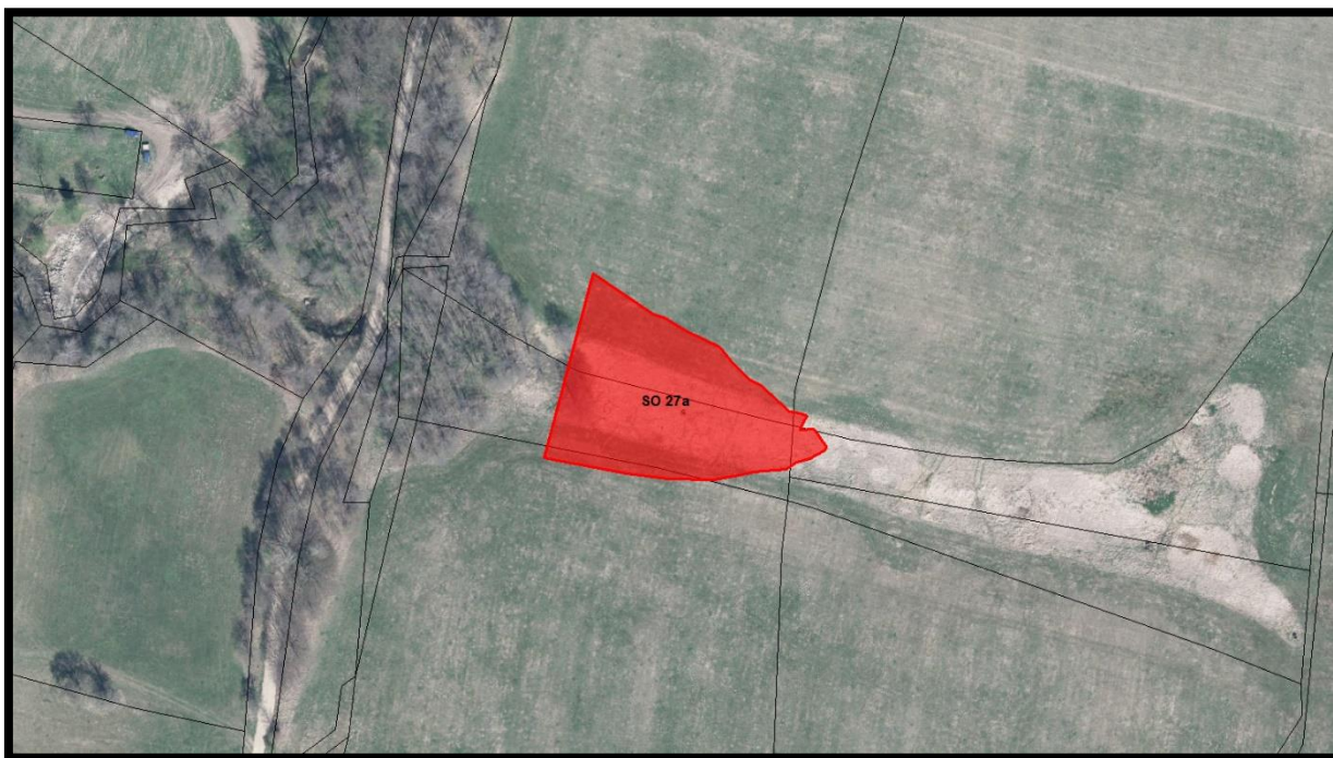
obr. 4 – Detail umístění suché vodní nádrže

Navrhuje se nová výstavba suché vodní nádrže umístěné na bezejmenném vodním toce. V současné době se jedná o nevyužívaný pozemek.