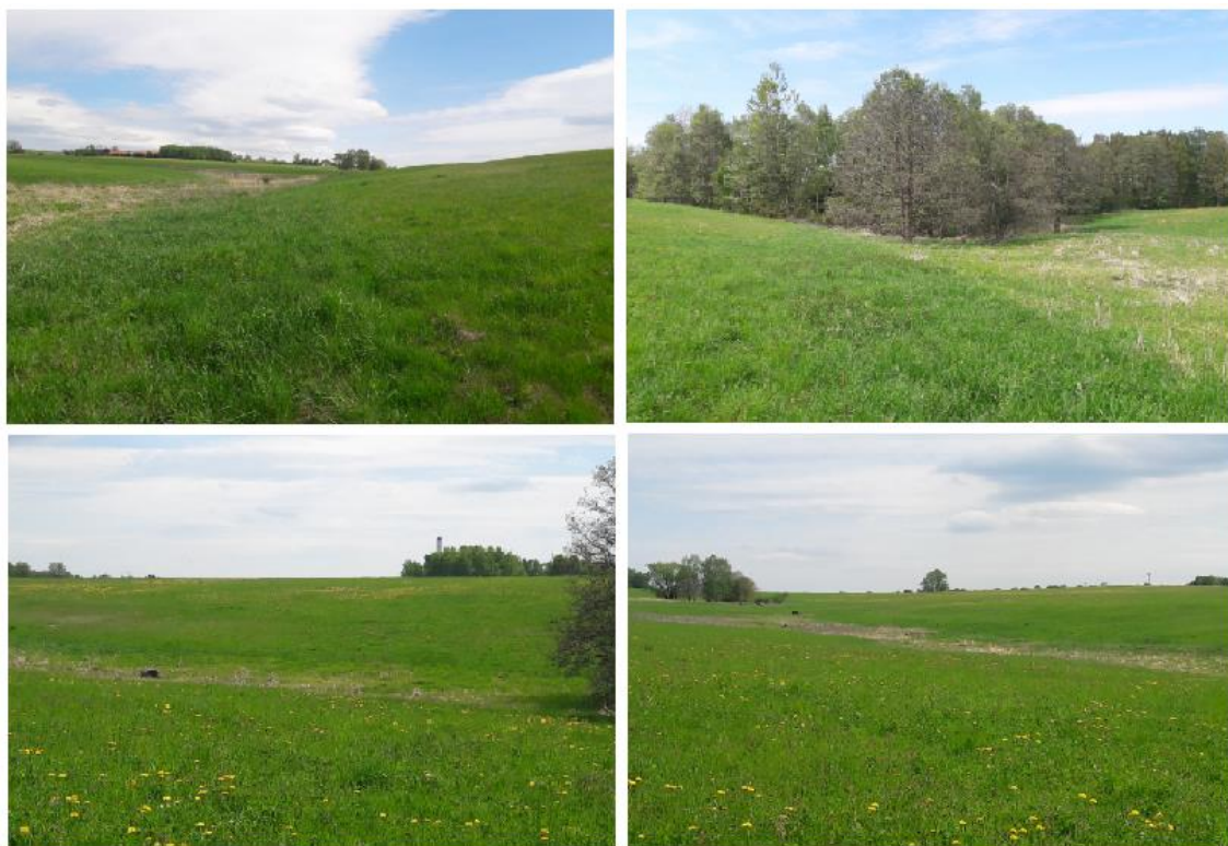
obr. 2 - Fotodokumentace navrhovaného opatření